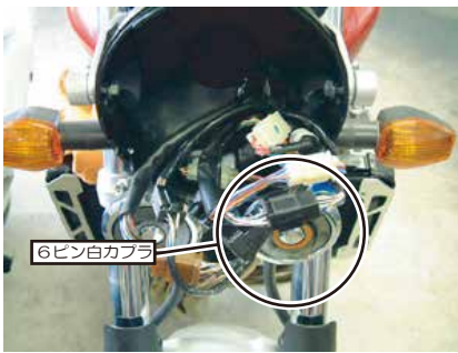
図1 ヘッドライトケース内部