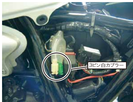
図4 サイドカバー内

HID装着等でバラストがある場合は、離れた所に設置してください、ノイズ等で誤作動を起こす事も考えられます。