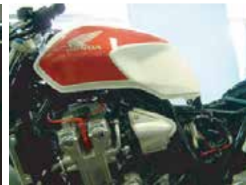
図7 タンク浮かし状態