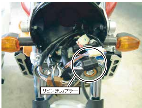
図1 ヘッドライトケース内部