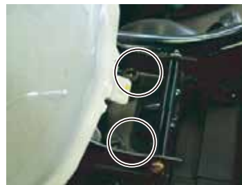
図6 タンク後部ボルト

※この配線はエンジン等の発熱する部分に接触しない場所を通すように十分注意してください。 ※ピンク線はスピードメーターセンサーの信号をスピードメーターに送っています、ハンドルを左右に切っても配線が突っ張らない位置で、タイラップ(短)にて固定してください。