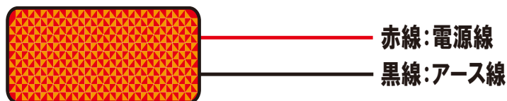
ワンタッチカプラーの使用方法