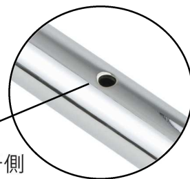
アクセル側/クラッチ側 穴あけ加工済