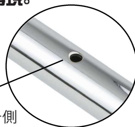
アクセル側/クラッチ側 穴あけ加工済