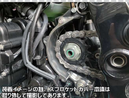
装着イメージの為、スプロケットカバー本体は 取り外して撮影してあります。