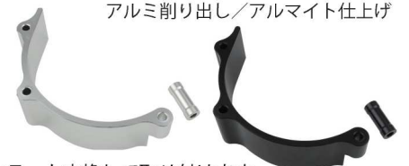
アルミ削り出し/アルマイト仕上げ