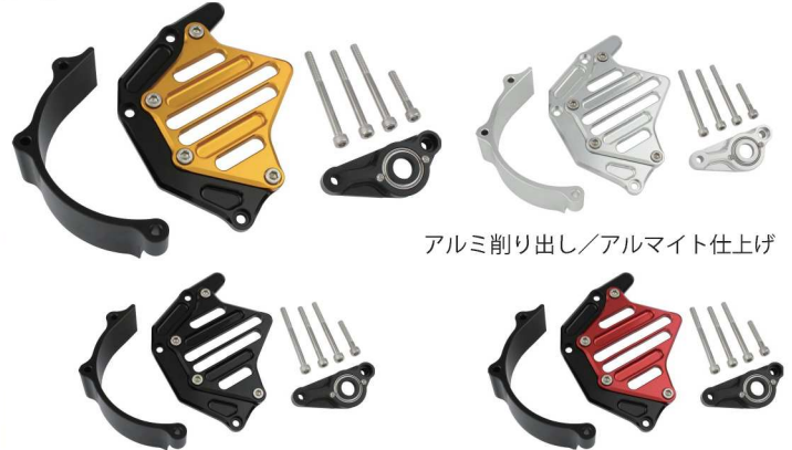
アルミ削り出し/アルマイト仕上げ