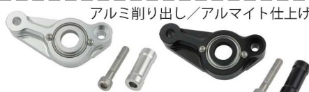
アルミ削り出し/アルマイト仕上げ