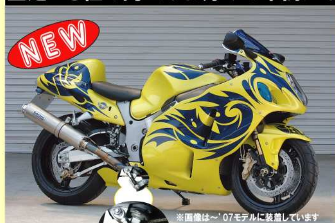
※画像は'07モデルに装着しています