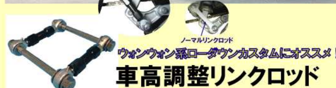
ノーマルリンクロッド