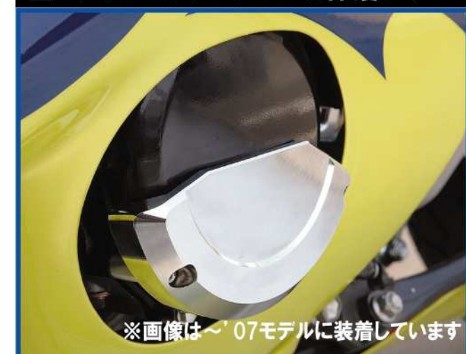
※画像は'07モデルに装着しています