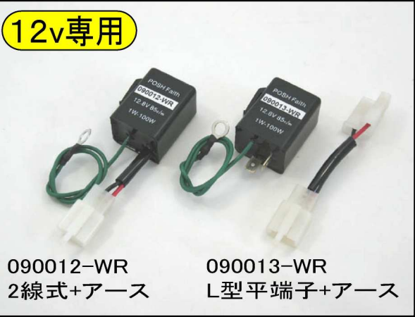
090012-WR 2線式+アース 090013-WR L型平端子+アース 090013-WRは変換カプラー付き。 2線、3線、L型平端子の全てのタイプに装着可能。 コレ1つあればあらゆる車種に対応します。