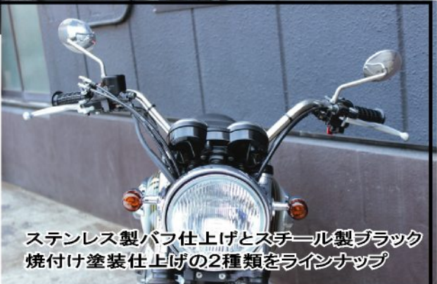
ステンレス製バフ仕上げとスチール製ブラック 焼付け塗装仕上げの2種類をラインナップ