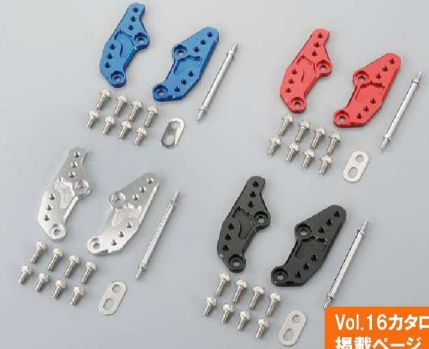
Vol.16カタログ 掲載ページ P.013