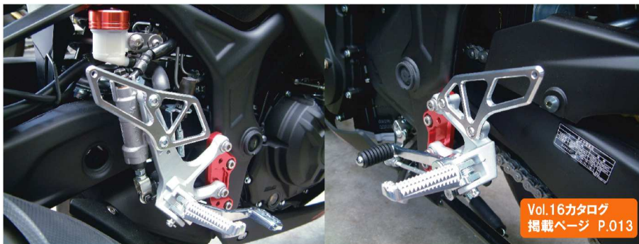
Vol.16カタログ 掲載ページ P.013

手軽にステップポジションを変更。大好評のステップアッププレートにR25/3A・MT-25用が発売開始！ アルミ削り出し・アルマイト仕上げ。専用チェンジロッド付属のボルトオン設計。ステップ位置は、3ポジションから選択可能。 ※ステップポジション位置によっては、リヤマスターシリンダーリザーバータンクホースのカットが必要となります。